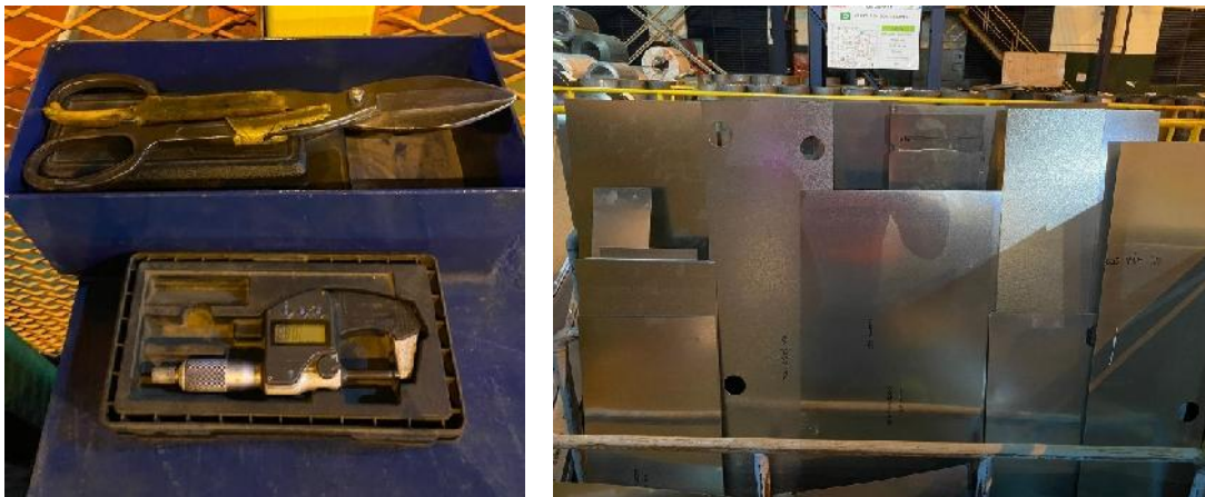
Gambar 3. Kondisi setelah penerapan 5S

Penerapan metode 5S secara konsisten dapat meningkatkan keteraturan, efisiensi, dan keselamatan di area kerja. Dengan menerapkan prinsip Seiri , Seiton , dan Seiso , alat dan material kerja dapat ditata dengan sistematis sehingga memudahkan akses, meminimalkan waktu pencarian, dan menciptakan lingkungan kerja yang lebih bersih dan aman. Adapun kondisi setelah penerapan 5S dapat dilihat pada Gambar 3.