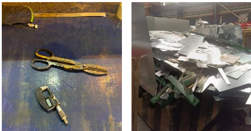
Gambar 1. Kondisi sebelum Penerapan 5S

Lingkungan kerja yang tidak tertata dengan baik dapat menghambat efisiensi operasional dan meningkatkan potensi terjadinya kecelakaan kerja. Dalam banyak kasus, ketiadaan sistem pengelolaan area kerja yang terstandarisasi menyebabkan penempatan alat dan bahan menjadi tidak terorganisir, serta menimbulkan akumulasi material yang tidak diperlukan. Hal ini menunjukkan perlunya penerapan metode 5S, sebagai strategi untuk menciptakan tempat kerja yang lebih produktif, aman, dan efisien. Adapun kondisi sebelum penerapan 5S dapat dilihat pada Gambar 1.